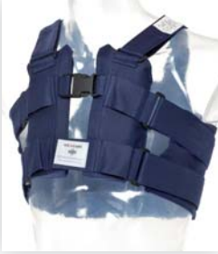
POSTHORAX® PRO STÜTZWESTE

Anwendung: postoperativ / nach Mobilisierung des Patienten und während der gesamten Rehabilitation. Tragedauer: konstant Tag und Nacht für 6-8 Wochen bis die beiden Brustbein-Hälften (Sternum) gut und stabil zusammengewachsen/verheilt sind.