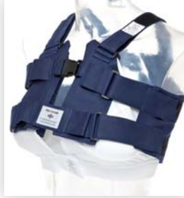
POSTHORAX® PRO STÜTZWESTE mit Damen Stütz-BH